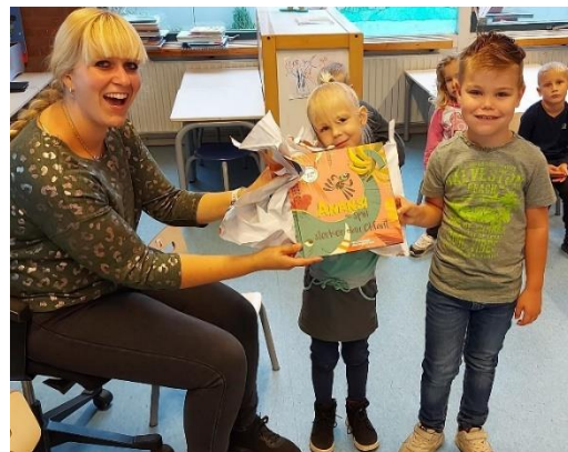
Groep 1/2 krijgt het boek "Anansie de spin, sterker dan Olifant"