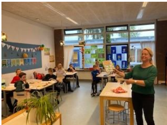
Groep 7 krijgt het boek "Palmen op de Noordpool"