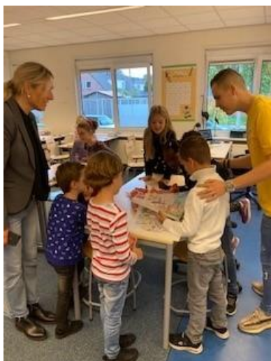
Groep 3/4 krijgt "Het Schitterende Samen Boek"

Als het goed is, is het nieuwe schoolgebouw eind april klaar en gaan we na de zomervakantie in De Mende van start! We zijn erg benieuwd naar het uiteindelijke resultaat. Op ons Instagramaccount (obs_de_mende) ziet u foto's van de voortgang). Volgt u ons al?