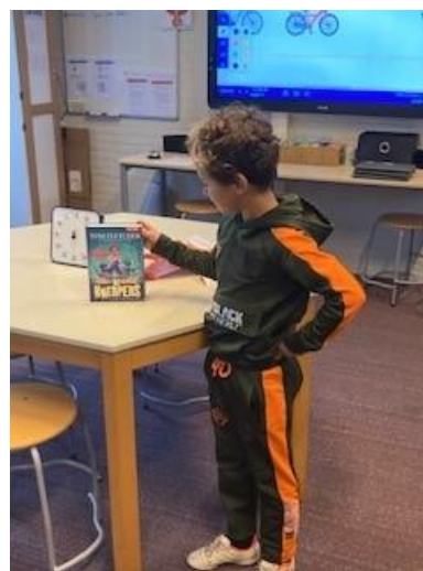
Groep 5/6 krijgt het boek "De Knerpers"