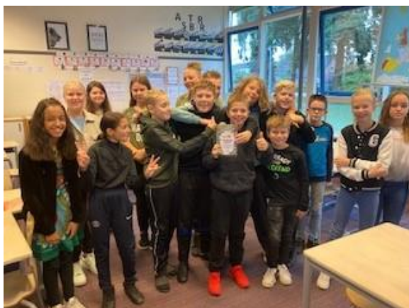
Groep 8 krijgt het boek "De ontdekkingsreiziger"